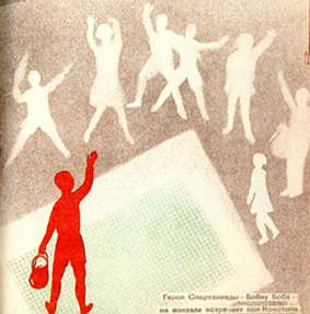
Герои Спартакиады - Бобин Боба на вокзале встречает пол-Конотоп